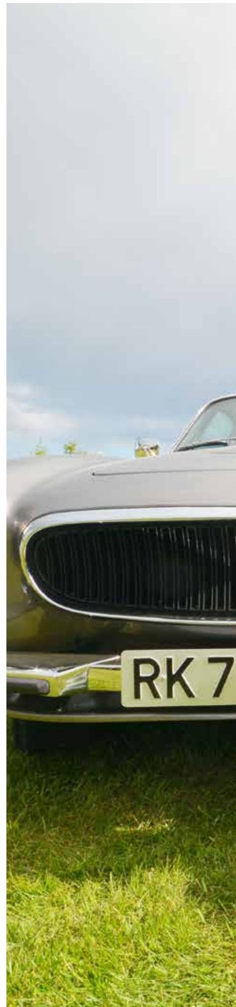
Lars Risvold var godt fornøyd med treffet.