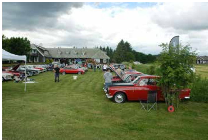
Mange biler var samlet til treff.