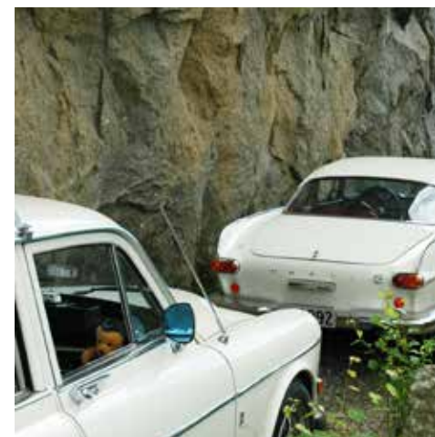
Her er bilene på god vei opp Bønsbakkene